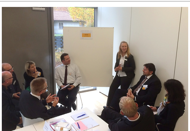
Regel Austausch auf dem AnwenderForum in Karlsruhe

Eine erfolgreiche Zusammenarbeit lebt vom Dialog. In diesem Sinne hat die VR KreditService die Herbstzeit genutzt und sich mit Kunden und interessierten Banken zur Diskussion und zum Erfahrungsaustausch getroffen.