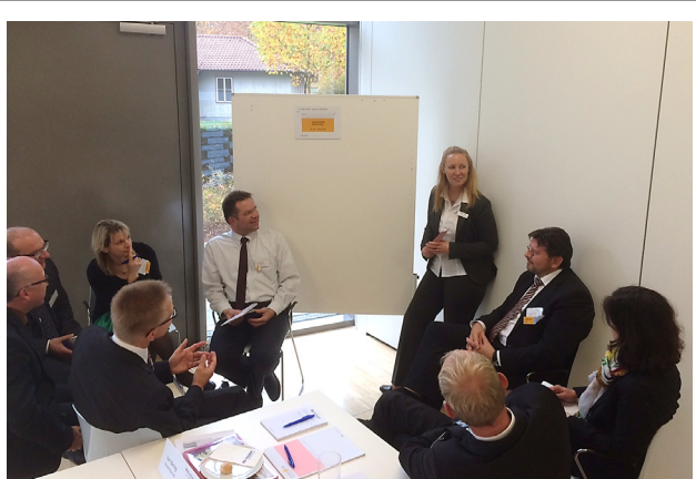
Regel Austausch auf dem AnwenderForum in Karlsruhe

Eine erfolgreiche Zusammenarbeit lebt vom Dialog. In diesem Sinne hat die VR KreditService die Herbstzeit genutzt und sich mit Kunden und interessierten Banken zur Diskussion und zum Erfahrungsaustausch getroffen.