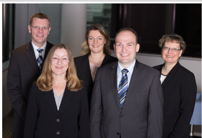
Das Kundensupport-Team der VR Kreditservice

„Dürfen wir uns vorstellen? Das sind die Ihnen täglich mit Rat und Tat zu BauFi Gesichter zu den Telefonstimmen, die FastLane zur Seite stehen. Wir beant-