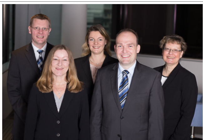
Das Kundensupport-Team der VR Kreditservice

„Dürfen wir uns vorstellen? Das sind die Ihnen täglich mit Rat und Tat zu BauFi Gesichter zu den Telefonstimmen, die FastLane zur Seite stehen. Wir beant-